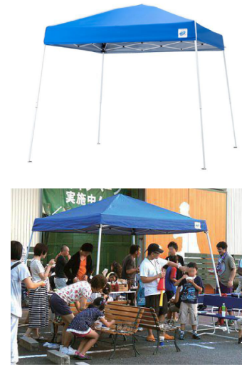
テントセットのイメージ